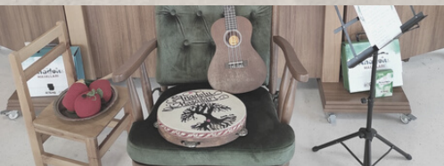
çekme - 3